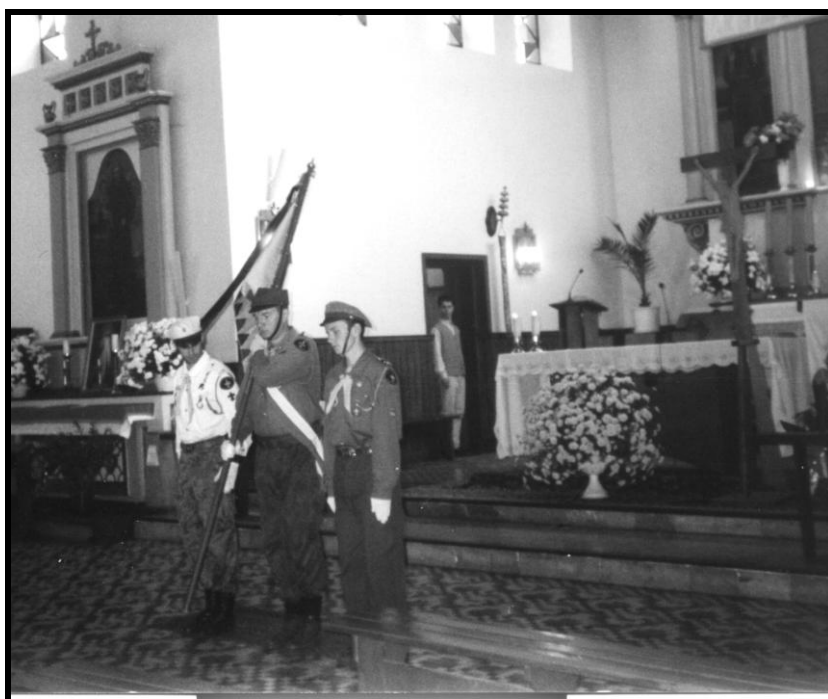
Poczet sztandarowy podczas uroczystości 10 lecia XXXV LO w Łodzi.